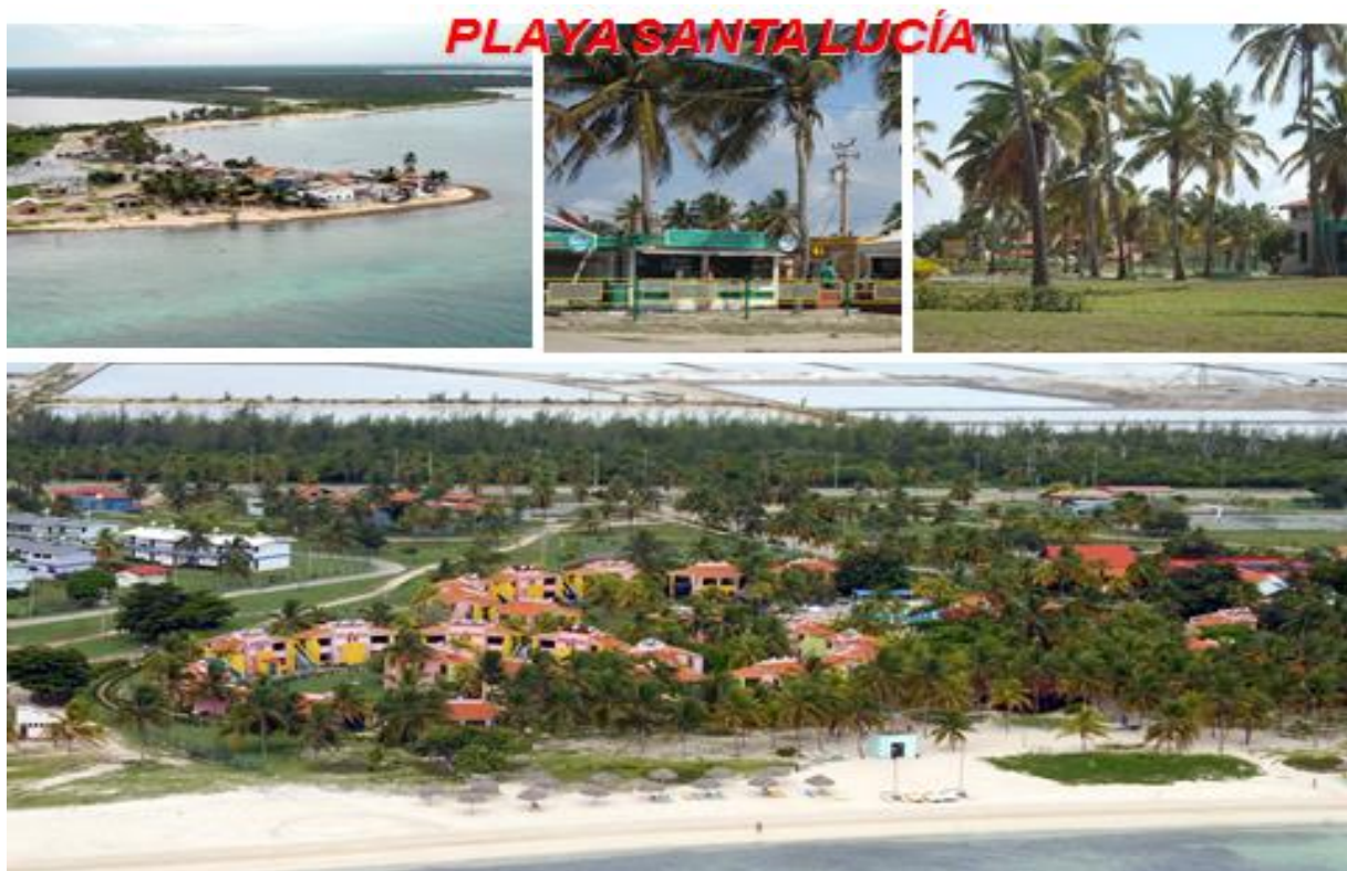
Figura N° 1: Playa Santa Lucía, municipio Nuevitas, Camagüey

La actividad turística recreativa, se desarrolla en las tres zonas objeto de estudio, si se tiene en cuenta las rutas de turismo de la naturaleza que tienen como destino Playa Bonita, ubicada en cayo Sabinal y cayo Ballenato del Medio dentro de la Bahía. El turismo se desarrolla potencialmente en el área de Santa Lucía reconocido como el polo turístico más importante de la provincia.