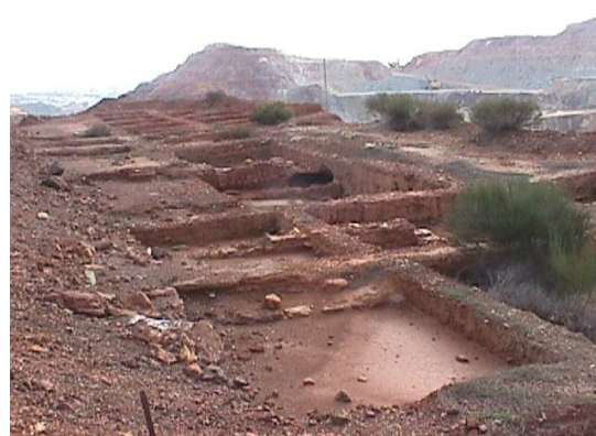
Poblado romano en Corta Lago