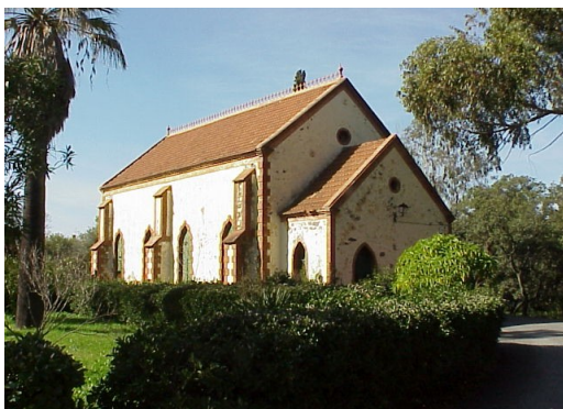
Capilla anglicana en Barrio Bellavista