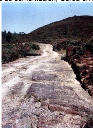
Calzada romana en Peña del Hierro