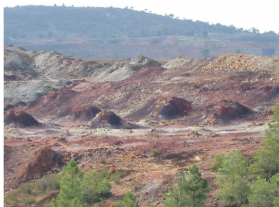
Teleros en “Masa Planes”