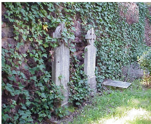
Cementerio inglés en Barrio Bellavista