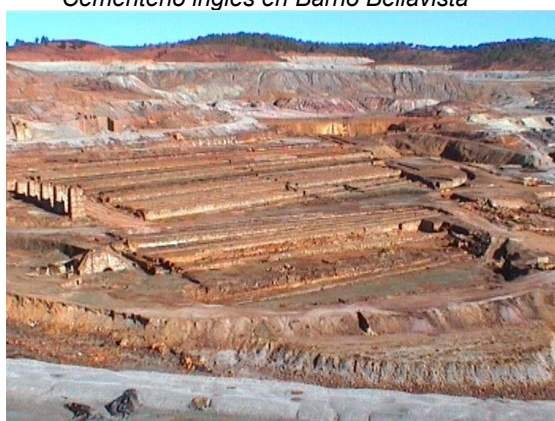
Canaleos de cementación, Cerda en Zarandas