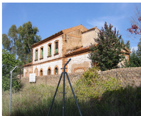
Estación de El Valle